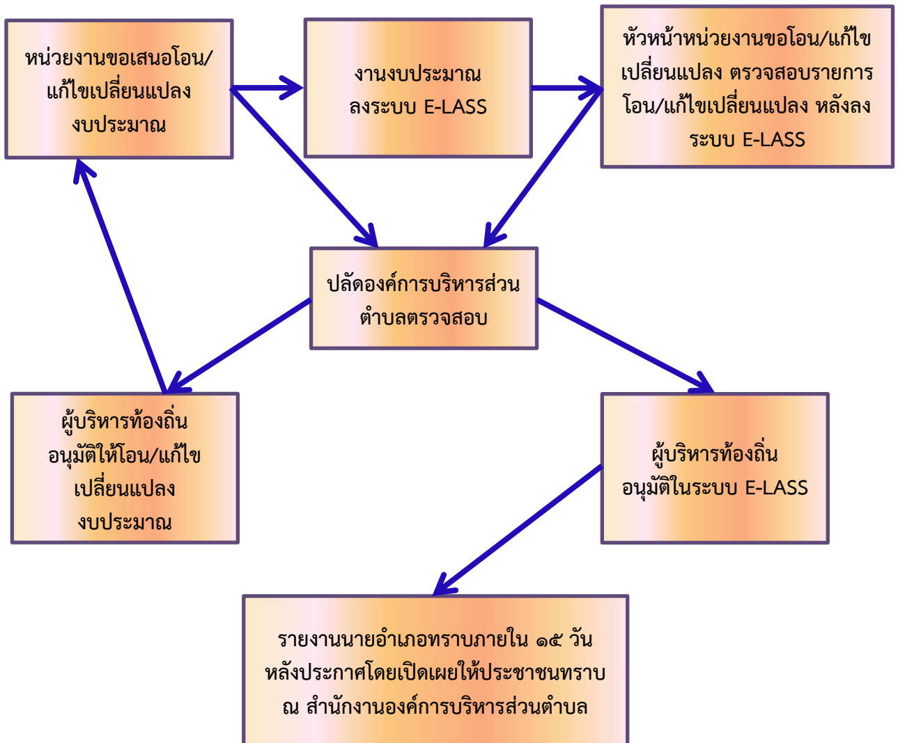
แผนภาพที่ ๒ ขั้นตอนการโอน/เปลี่ยนแปลงงบประมาณรายจ่าย (อำนาจผู้บริหาร)

๗.๗ การโอนเงินงบประมาณรายจ่าย หรือการแก้ไขเปลี่ยนแปลงคำชี้แจงประมาณการรายรับและงบประมาณรายจ่าย เมื่อได้รับอนุมัติจากผู้มีอำนาจแล้ว ให้ประกาศโดยเปิดเผยเพื่อให้ประชาชนทราบ แล้วแจ้งการประกาศให้ผู้ว่าราชการจังหวัดเพื่อทราบภายในสิบห้าวัน